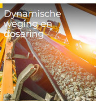
Dynamische weging en dosering

DYNAMISCHE WEGING EN DOSERING · STATISCHE WEGING · PRODUCTINSPECTIE · PROCES EN CONTROLE · AAN-BOORD WEGING