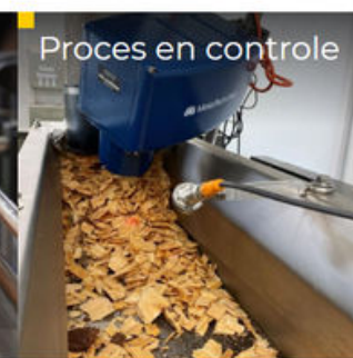
Proces en controle