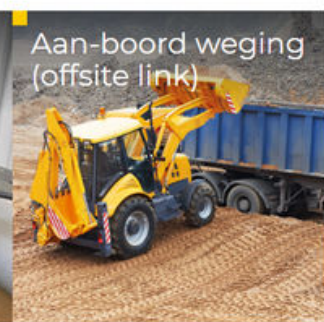
Aan-boord weging (offsite link)